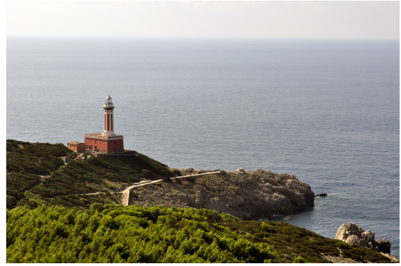
Faro di Punta Carena