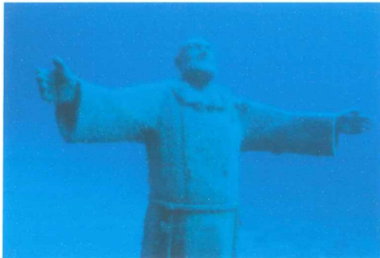
Statua San Pio a largo dell'isola di Capraia

Abbigliamento e attrezzatura sono i soliti da escursione: