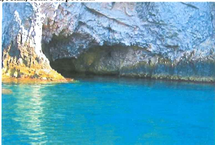
Grotta del Bue Marino - San Domino

PERCORSO ESCURSIONE: a breve distanza dall'albergo, si scende a Cala Matano (indicata con il n° 16 nella segnaletica della Forestale) passando sotto la villa di Lucio Dalla; si prosegue a destra verso Punta del Pigno (indicato con il n° 15 nella suddetta segnaletica) e da qui si imbocca il sentiero n° 1, 'Perimetrale'. Ci si ferma ai vari punti panoramici e si scende alla Cala delle Viole. Tornati sul sentiero, si prosegue verso ovest per poi scendere ancora al Faro e alla Grotta del Bue Marino. Con una breve salita, si raggiunge il cosiddetto Colle dell'Eremita (116m) da dove si gode di una favolosa vista panoramica sull'isola. Dopo una sosta, con eventuale consumazione del pranzo a sacco, si riprende il cammino lungo una strada pavimentata con betonelle che riporta verso il centro abitato. Al tabellone con le indicazioni turistiche si svolta a sinistra verso la Cala delle Rondinelle e poi verso la Cala dei Benedettini e la successiva Cala degli Inglesi. Se le condizioni atmosferiche lo consentono, è il momento di tuffarsi in mare. Con molta calma raggiungeremo poi l'albergo per le successive piacevoli incombenze: doccia, relax, cena e dopocena.