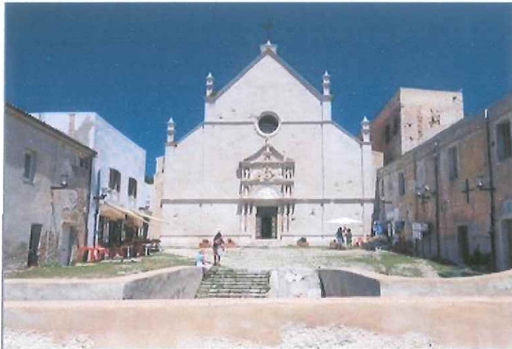
Il Santuario di Santa Maria a Mare di San Nicola

Trasferimento con barca all'isola di San Domino per rientro a Termoli.